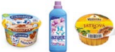
PRIBINÁČEK KRUPÍČKA SAVENCIA FROMAGE & DAIRY CZECH REPUBLIC AZURIT AVIVÁŽNÍ PROSTŘEDKY, TOMIL PAŠTIKY KRAJANKA, ALIMPEX FOOD