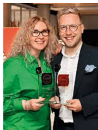
Zástupci společnosti Billa si převzali ceny za své vítězné produkty Billa Nice Bites a řadu moravských vín Sol Vineus.