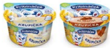
PRIBINÁČEK KRUPÍČKA SAVENCIA FROMAGE & DAIRY CZECH REPUBLIC