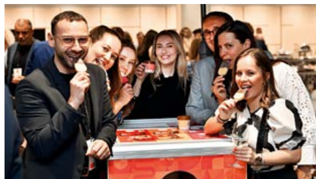
Benešovská továrna na zmrzlinu společnosti Pinko se se svými nanuky postarala o příjemné a chutné osvěžení účastníků večera.