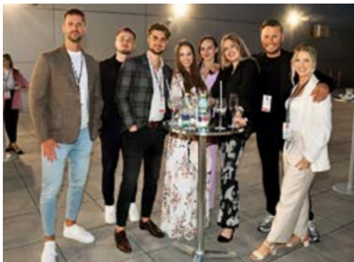
Účastníci si mohli vychutnat příjemný večer s drinky na terase.