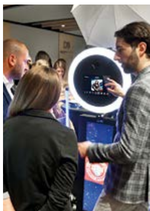
Networkingová party si pro účastníky nachystala i překvapení v podobě AI fotokoutku, který byl celý večer v obléžení zájemců.