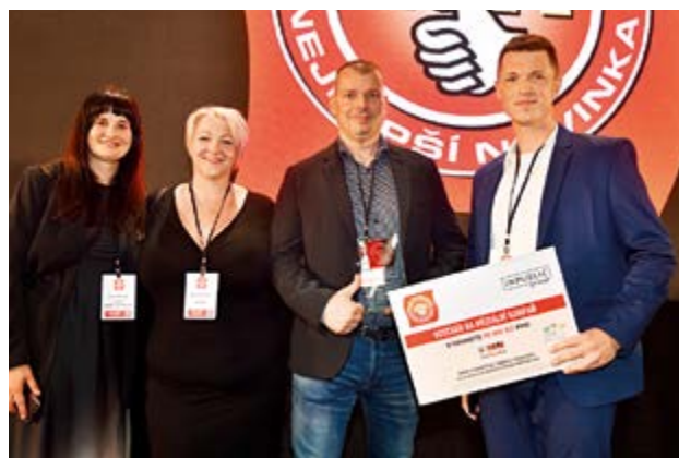
Společnost Albert Česká republika si odnesla vítěznou trofej za inspirativní řadu Albertova tržnice Menu box, za kterou zároveň získala dárkový voucher od mediálního partnera InPublic Group.