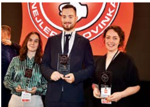
Společnost Mattoni 1873 letos zabodovala hned se třemi produktovými novinkami.