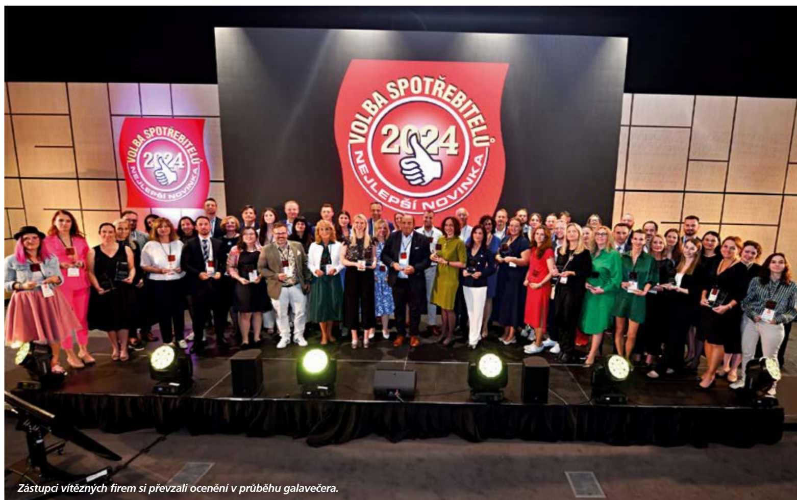
Zástupci vítězných firem si převzali ocenění v průběhu galavečera.