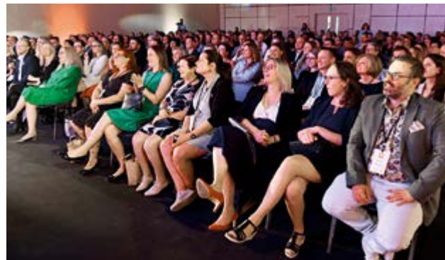
Slavnostního večera se zúčastnilo více než tři sta zástupců vítězných firem.