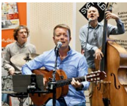
Během večírku zahrála kapela The Aliments.