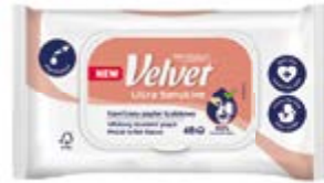
VELVET VLHČENÝ TOALETNÍ PAPÍR ULTRA SENSITIVE MORACELL