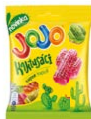
JOJO KAKTUSÁCI NESTLÉ ČESKO