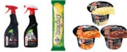
SHERON SADA NA ČIŠTĚNÍ KOL DF PARTNER BANÁNY BÍLÉ, NESTLÉ ČESKO ZOTT PROTEIN PUDING, ZOTT