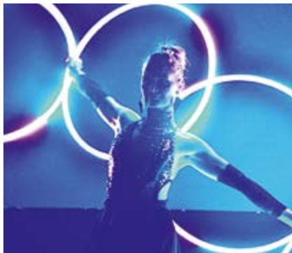
Zpestřením večera se stalo okouzlující vystoupení Hula hoop light show.