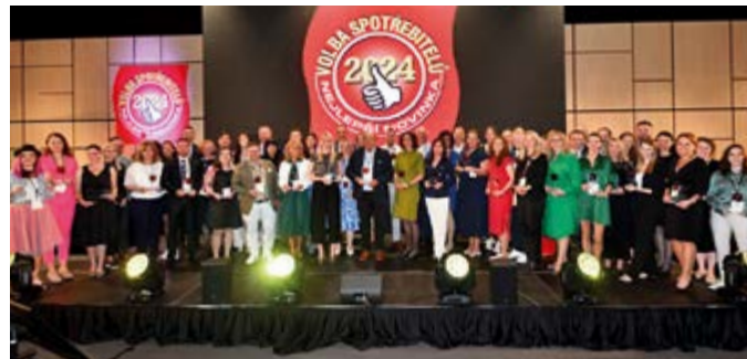
Všem vítězům patří velká gratulace.