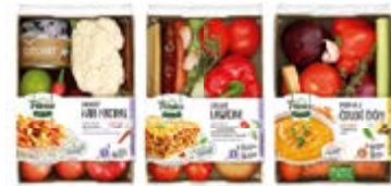
ŘADA ALBERTOVA TRŽNICE MENU BOX ALBERT ČESKÁ REPUBLIKA